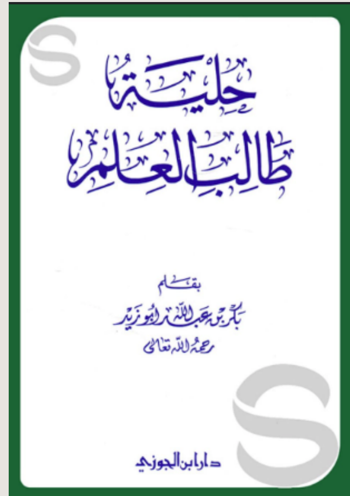
حلية طالب العلم